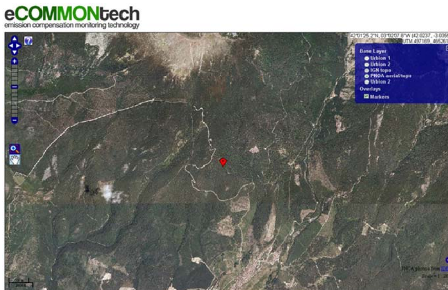
Figura 2. Aspecto general del servicio de visualización

En general, un servidor WMS es invocado mediante el envío de peticiones a una URL. Dicha petición es recibida y procesada por el servidor, que devolverá como resultado la imagen solicitada. Una característica interesante del servidor del proyecto eCOMMONtech es que las peticiones de las diferentes capas no tienen por qué ser solicitadas al mismo servidor, pudiendo provenir de diferentes fuentes. Si dichas imágenes están codificadas en formatos que admiten transparencias, como GIF o PNG, las diferentes capas se pueden superponer, permitiendo un solapamiento de las mismas en la imagen final. De este modo, utilizando un único servicio web, es posible unificar la visualización de diferentes fuentes cartográficas desde el propio navegador (IGN, PNOA, fuentes de datos propias, etc.), no siendo necesaria la utilización de sistemas SIG más pesados. La figura 2 representa el aspecto general de dicho servicio de visualización: